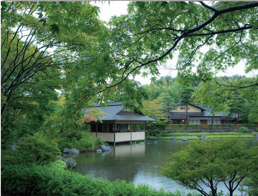
国営昭和記念公園(東京都立川市) 日本庭園 落ち着く場所です。