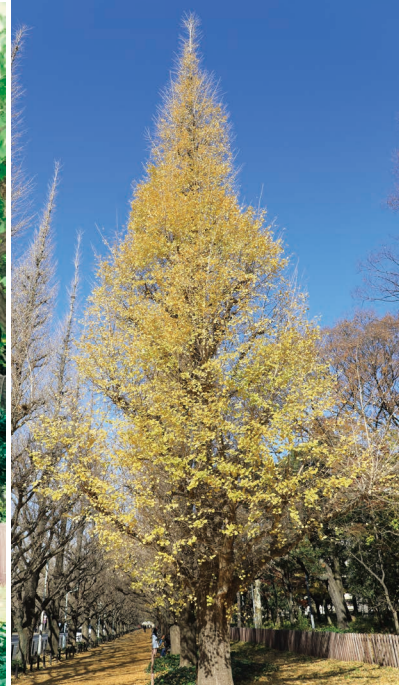
秋に撮影した、いちょう並木