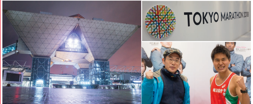
東京ビッグサイト(東京国際展示場) 川内そっくりさん?と記念写真 世界の都市マラソンに数年毎に参加して、各地の写真を撮りたいです。

25日日曜日に行われる東京マラソンの受付に行きました。 会場ではマラソンアドバイスやマラソン関連情報を得られ、 マラソンに興味ある人はきっと楽しめると思います。 24日まで東京ビッグサイトで開催しています。