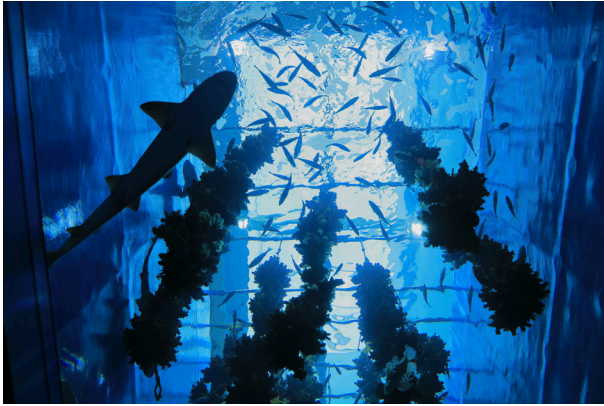
( 仙台うみの杜水族館 )

上を見上げればキリがない。 とても自分には届かないと諦めかける。 でも、すでにそこにいる人たちも 最初からそこにいるわけではない。 やっぱり、一つ一つ段階を 踏んでいったのだと思う。 上を見上げればキリがない。 だからここでいいやと思うか、 一つ一つ段階を踏んでいくか、 決めるのは自分次第。